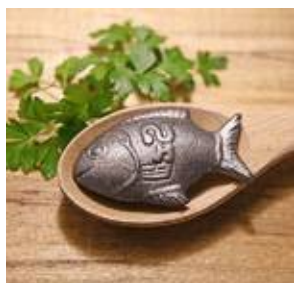
Le petit poisson en fonte qui enrichit en fer eau, soupes et bouillons.

Yaya, 8, rue de l'Hippodrome, 93400 Saint-Ouen, tél. : 01 44 04 27 65. Tavline, 25, rue du Roi-de-Sicile, 75004 Paris, tél. : 09 86 55 65 65. Balagan, 9, rue d'Alger, 75001 Paris, tél. : 01 40 20 72 14. Bonhomie, 22, rue d'Enghien, 75010 Paris, tél. : 09 83 88 82 51.