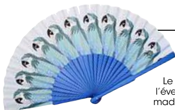
Le grand retour de l'éventail... si possible made in Paris, so chic !