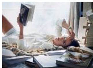
Dernière tendance du moment : lire au lit sans courbatures...