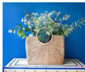
On offre une seconde chance à nos paniers en les transformant en objet déco gypset.

Wundr, l'appli pour booker les meilleurs experts zen, look et detox.