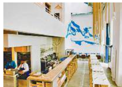
Yaya, le meilleur de la cuisine grecque version 2017.