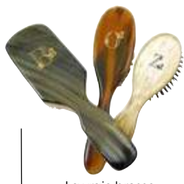
La vraie brosse à cheveux, en bois et soie de porc.