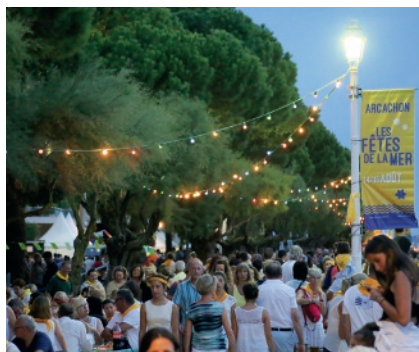
▲ LES FÊTES DE LA MER, INCONTOURNABLES !

♦ OT d'Arcachon , 05-57-52-97-97, arcachon-tourisme.com