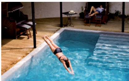
► LA PISCINE DE L'HÔTEL VILLE D'HIVER, À ARCACHON.

♥ O'Beauty & Spa , 960, avenue de l'Europe, La Teste-de-