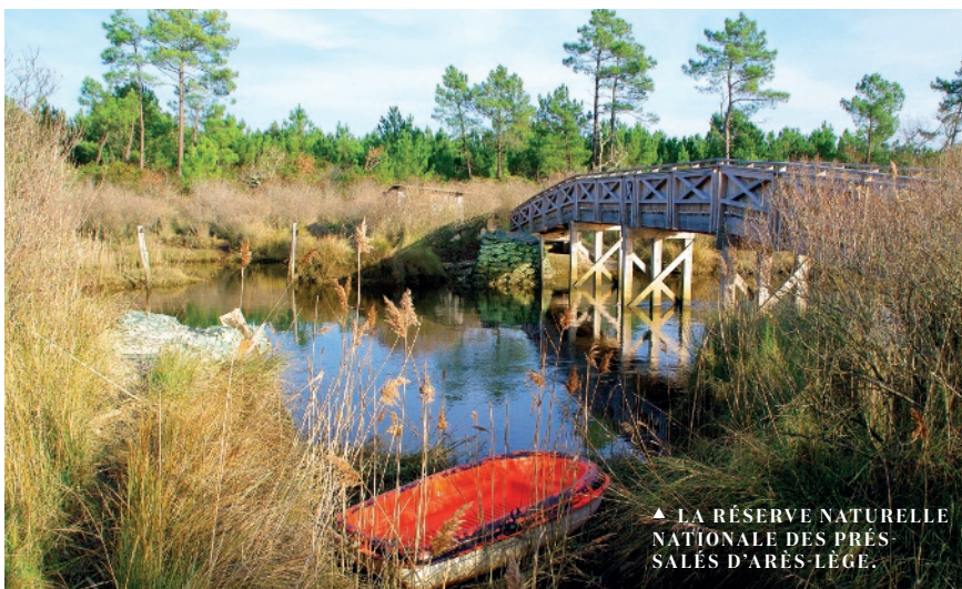
▲ LA RÉSERVE NATURELLE NATIONALE DES PRÉS-SALÉS D'ARÈS-LÈGE.

De A comme « Algue » à Z comme « Zostère » (une herbe marine), le sentier de l'« Abécédaire des dunes » vous conduit de l'entrée du Cap-Ferret à sa