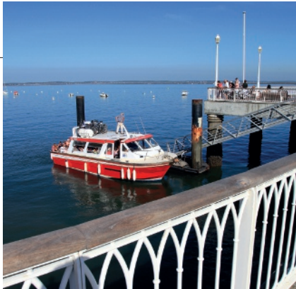
▲ LA JETÉE THIERS, À ARCACHON.

♥ Réserve ornithologique , rue du Port, Le Teich, 05-24-73-37-33, reserve-ornithologique-du-teich.com Adultes : 9 €, enfants : 6,80 €, visites guidées sur réséa.