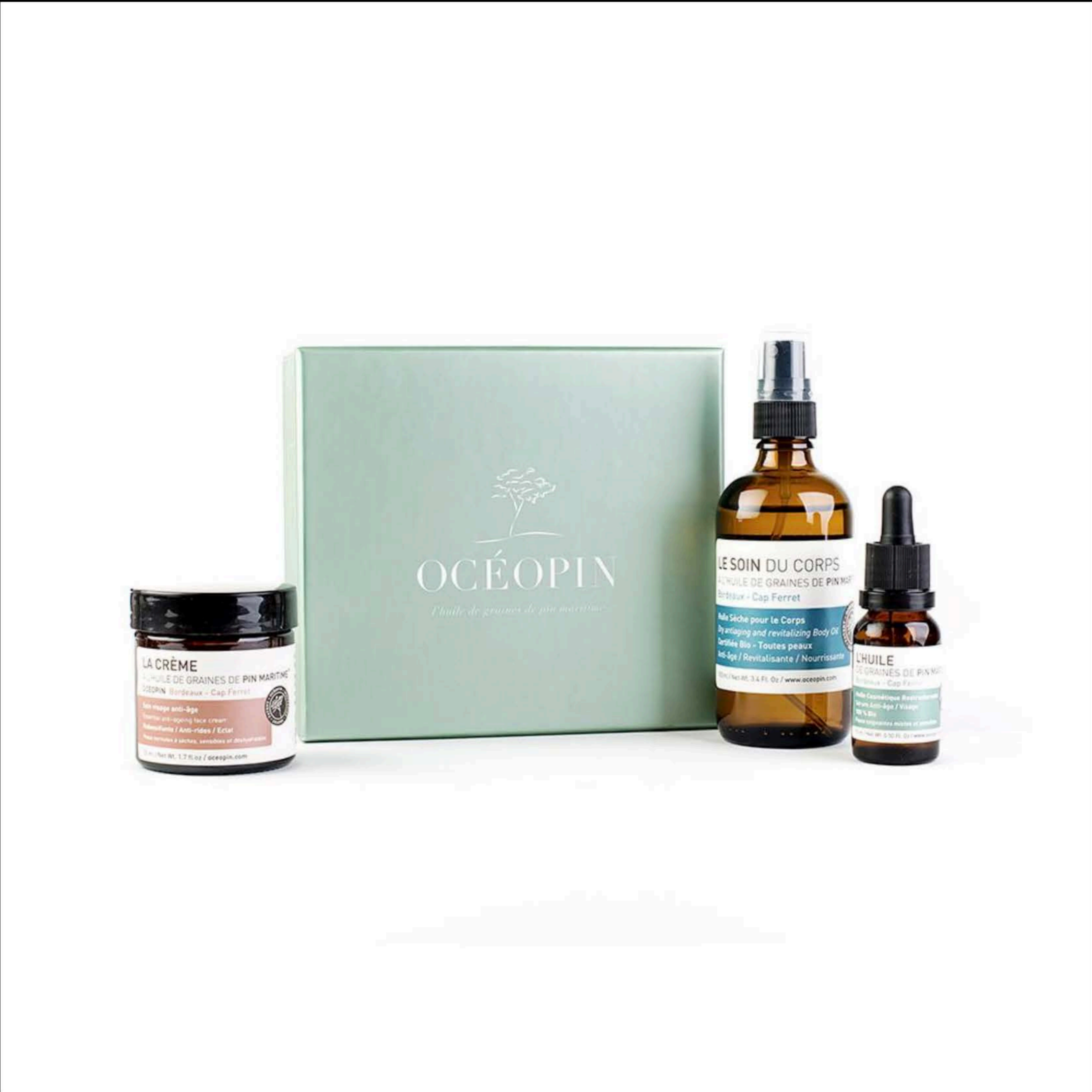
Océopin / Photo presse