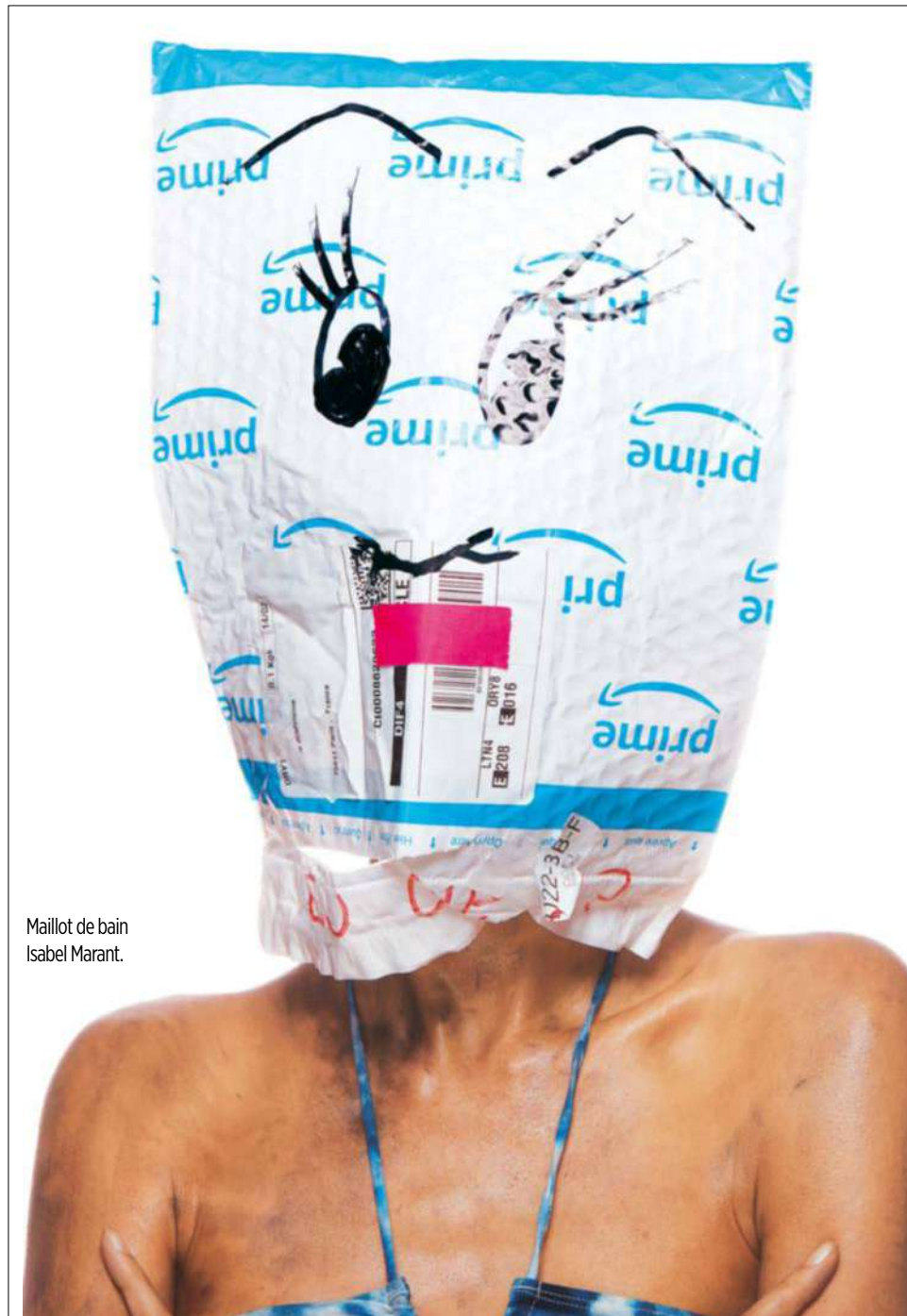
Maillot de bain Isabel Marant.

Son calcul répond à un véritable challenge : diminuer notre consommation de ressources naturelles afin d'éviter l'emballage climatique.