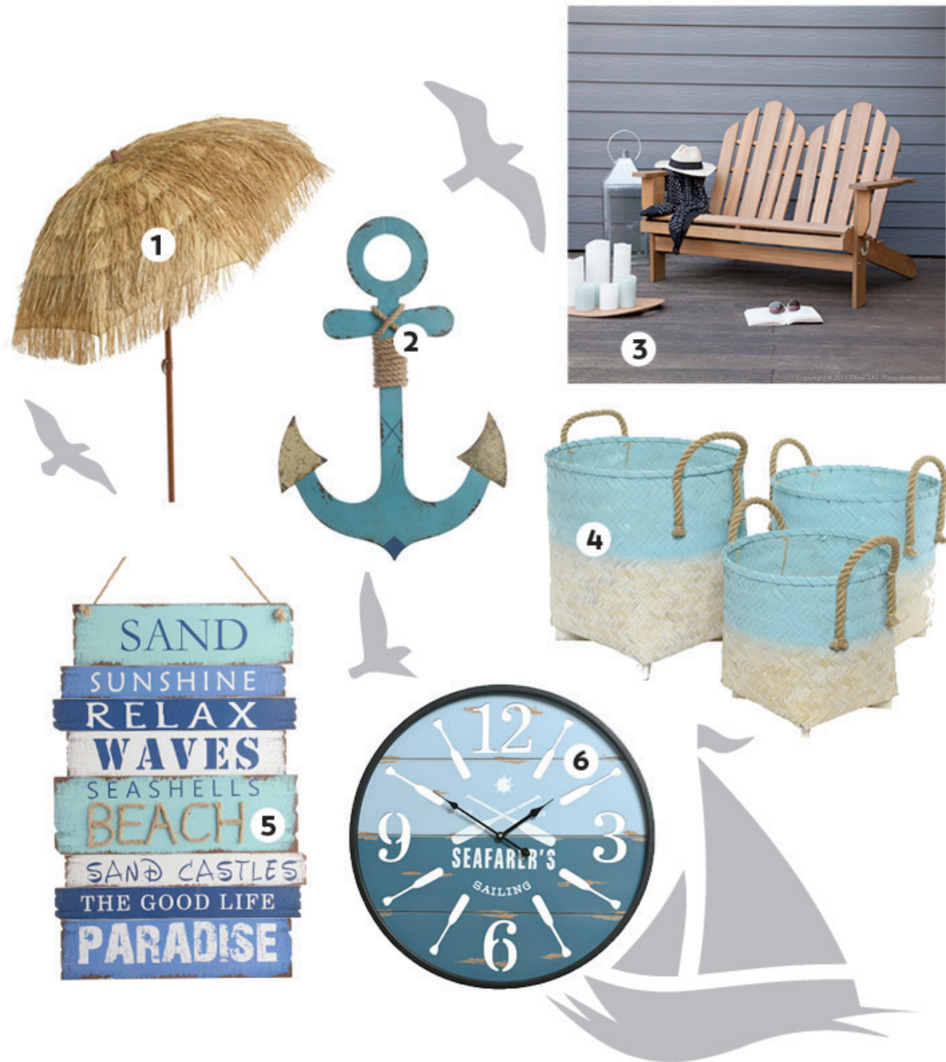
1. Parasol BORA - Bois et métal - 59 € 2. Ancre de bateau décoratif BEACH - Fer et corde - 36,90€ 3. Fauteuil RIVERHAUK - Acacia - 205 € 4. Panier BEACH - Bambou - 28,99 € 5. Panneau décoratif BEACH - Bois MDF et corde - 15,90 € 6. Horloge BEACH - Bois MDF - 52,90 €