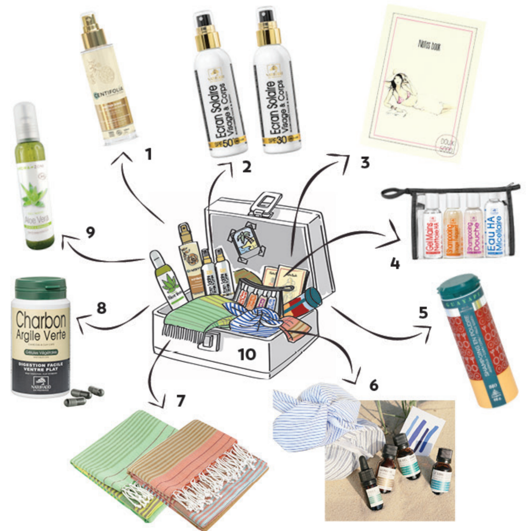
1. Centifolia- Huile sèche blo Nectar doré - 5 huiles précieuses (camélia, baobab, lys, jojoba et argan) - Nourri et répare la peau et cheveux - Flacon de 105 mL : 19,95€ - Disponible en magasins bio et sur le site www.centifoliabiobio.fr 2. Naturado- Écrans solaires SFP 30 et 50 - Spray de 100mL SFP 30 : 18,45€ - Spray de 100mL SFP 50 : 21,90€ 3. Doux Good- Notes book Détente à Palombaglia - 10€ - Disponible exclusivement sur www.doux-good.com 4. Naturado- Travel Kit bio - Les indispensables en format cabine - Certifiés bio : gel mains assainissant - Shampooing usage fréquent - Gel douche 'Rêve de Jasmin' - Eau micellaire - 14,50€ - Disponible en magasin de produits bio et diététiques et sur le site www.provence-argile.com 5. Guayapi- Shampooing poudre Acérola Camu-Camu et Palo Santo bio - Aux actifs de poudres pures de plantes déshydratées - 100% naturel - Sans conservateurs - Flacon de 50g : 22€ - En magasin bio et sur www.guayapi.com 6. Océopin- Le baluchon de soin - 4 miniatures Océopin pour visage et corps : mini gel lavant de 15 mL - Mini soin corps 15 mL - Mini poudre exfoliante de 15 mL - Mini huile visage repulpante 5 mL avec sa mini pipette - 36€ le baluchon de soin à nouer - Disponible exclusivement sur www.oceopin.com 7. Karawan- Fouta Sud Jungle et Terra Cota - Coton bio - Tissage à plat - 43€ - Disponible sur www.karawan.fr 8. Naturado- Gélules charbon-argile - Utiliser en cas de ballonnements - Digestion difficile - Aigreurs d'estomac et accélération du transit intestinal - pot de 45g : 15,70€ - disponible en magasin de produits bio et diététiques et sur le site www.provence-argile.com 9. Aroma-Zone Gel d'aloevera bio - Flacon de 250 mL : 6,90€ - www.aroma-zone.com 10. La valise éco&minimaliste de l'été