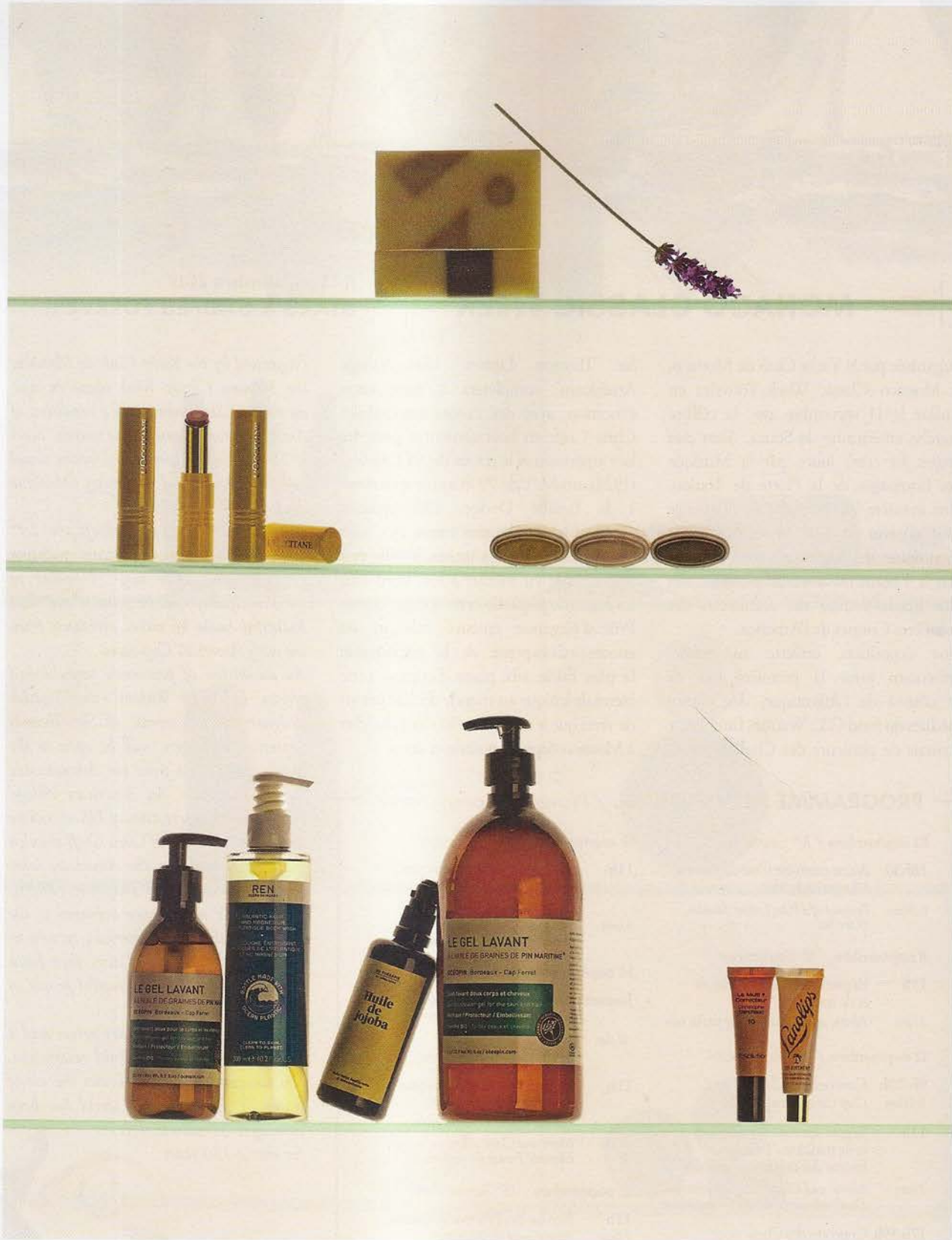
Savons naturels corps et visage Proposition n°5 beurre de karité et Proposition n°3 beurre de cacao, fabriqués à froid Dessein Rouges à lèvres Rouge de Fruit à base d'huile de grenade pressée à froid et d'huile de carotte bio L'Occitane Sticks solaires bio SPF 50+ non écotoxiques pour le milieu marin EQ Le Gel Lavant bio à l'huile de graines de pin maritime® corps et cheveux, petit et grand formats Océopin Gel douche énergisant aux algues de l'Atlantique et au magnésium, flacon rechargeable écoconçu à partir de plastiques collectés en mer REN Huile de Jojoba démaquillante biologique Ma Thérapie Le Multicorrecteur aux pigments naturels Christophe Danchaud n°10 Absolution Multi-baume 101 Ointment Noix de coco à base de lanoline naturelle Lanolips