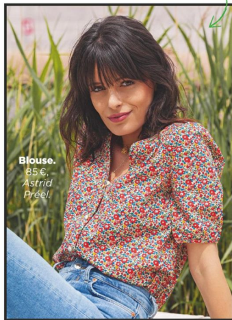
Blouse , 85 €, Astrid Prél.

« Astrid Prél crée un vestiaire de pièces intemporelles, de façon maîtrisée pour une mode anti-gâchis. J'aime les détails qui singularisent ses vêtements et je porte souvent ses créations à l'antenne. »