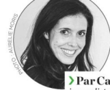
► Par Carole Tolila, journaliste et coprésidente de Silence, ça pousse!