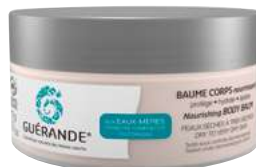
Baume Corps Nourrissant, Guérande , 18,50 €.