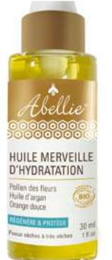
Huile Merveille d'Hydratation au pollen des fleurs et huile d'argan, Abellie , 22,90 €.