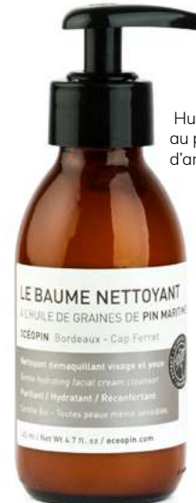
Baume Nettoyant à l'huile de graines de pin maritime, Océopin , 36 €.