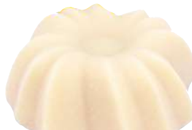
Après-shampooing Solide, Lamazuna , 12,50 €.