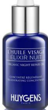
L'Huile Visage Élixir Nuit, Huygens , 36 €.