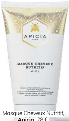
Masque Cheveux Nutritif, Apicia , 28 €.