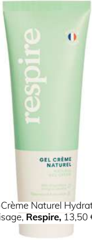
Gel-Crème Naturel Hydratant Visage, Respire , 13,50 €.