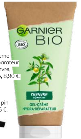
Gel-Crème Hydra-Réparateur au chanvre, Garnier Bio , 8,90 €.