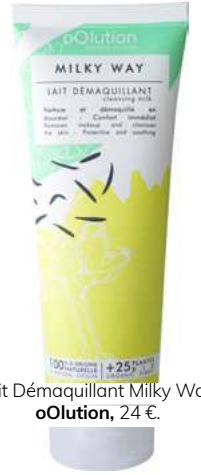
Lait Démaquillant Milky Way, oOllution , 24 €.