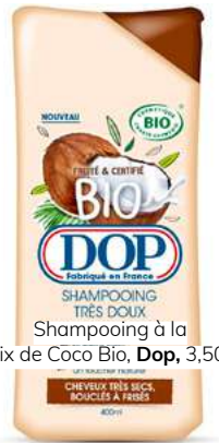
Shampooing à la Noix de Coco Bio, Dop , 3,50 €.