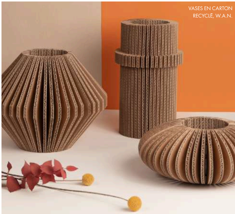
VASES EN CARTON RECYCLE, W.A.N.