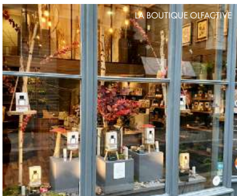
LA BOUTIQUE OLFACTIVE

22, rue Bouffard, Bordeaux. Tél. : 05 57 59 44 78. laboutiqueolfactive.fr