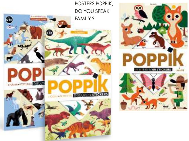
POSTERS POPPIK, DO YOU SPEAK FAMILY ?